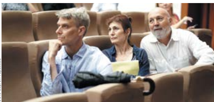
Ставить классику пригласили американских постановщиков

— Мы еще в 90-е ставили сцену из «Мастера и Маргариты», спек-