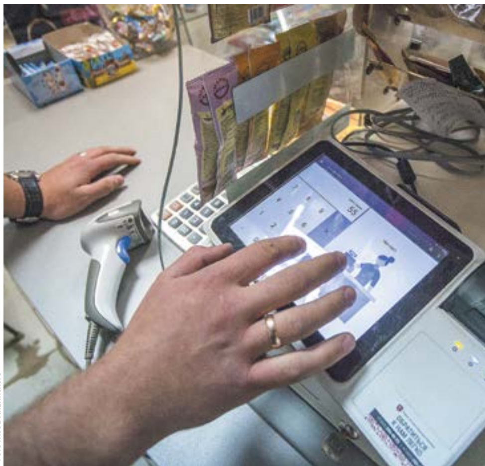
Покупателям с помощью новых чеков с QR-кодом будет проще вести личный бюджет

Всего в России в рамках третьей волны около 400 тысяч предпринимателей должны перейти на кассы нового поколения. По оценке Федеральной налоговой службы (ФНС), 280 тысяч из них — организации, оказывающие преимущественно услуги (за исключением