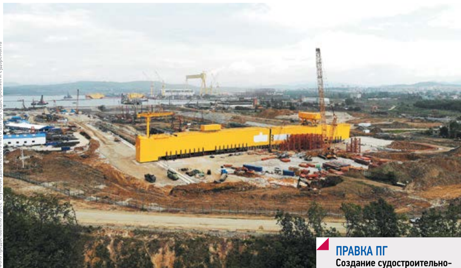
Основная часть второго крана-гиганта «Голиаф» установлена на территории строящегося сухого дока

Социальная инфраструктура Большого Камня выйдет на новый уровень