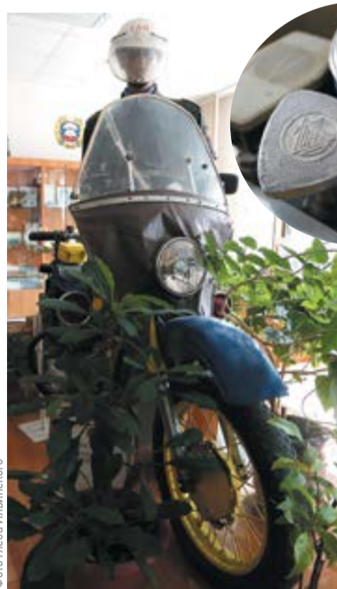
Мотоциклу «Урал» более 30 лет, но он до сих пор на ходу

В качестве первых радаров инспекторы ГАИ использовали наручные часы