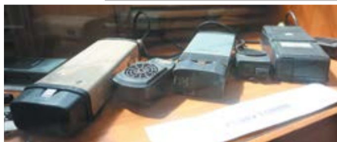
Радиостанции с каждым годом становятся легче, компактнее и мощнее...

(Из Правил дорожного движения, 1936 год)