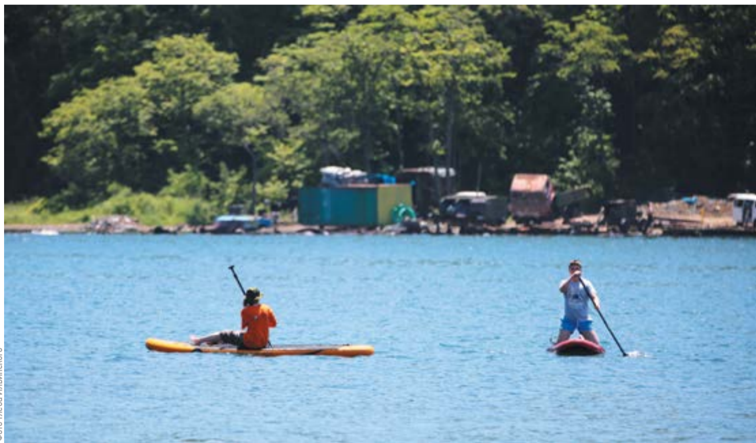
Прогулки на «сапах» — очень популярный вид отдыха в Приморье

дит представитель администрации населенного пункта. Есть ли в месте отдыха биотуалет, кабинки для переодевания, исправна ли канализация и необходимое в работе оборудование. Техническому персоналу пляжа после его закрытия необходимо убрать мусор с берега, навести порядок в раздевалках, туалетах, осмотреть зеленую зону, провести мойку тары и дезинфекцию туалетов.