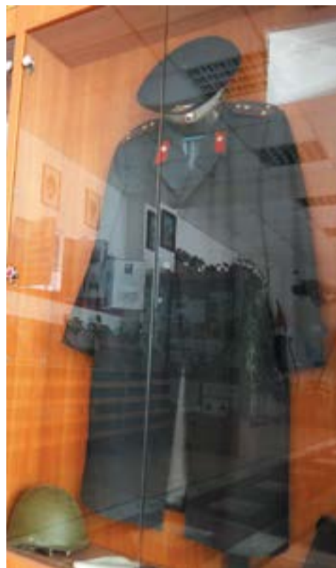
... а плащ инспектора ГАИ теперь более легкий и удобный