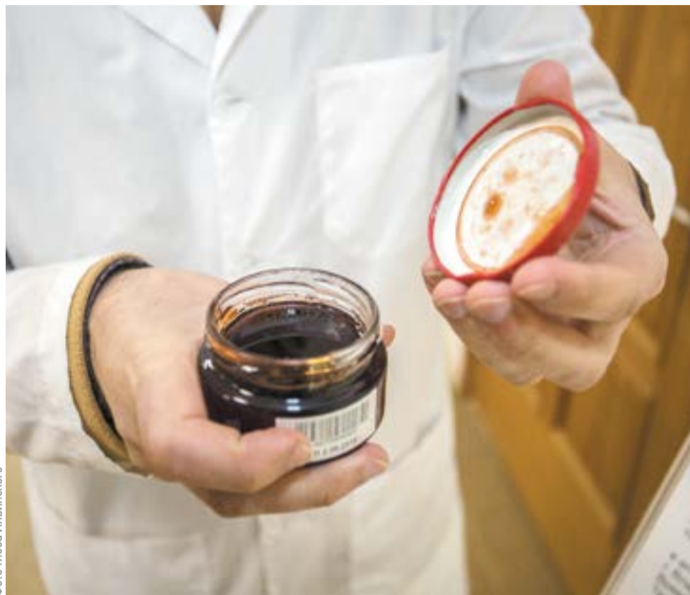
Баночка меда с экстрактом морского ежа

Современные разработки позволяют продлить срок хранения продуктов без использования консервантов