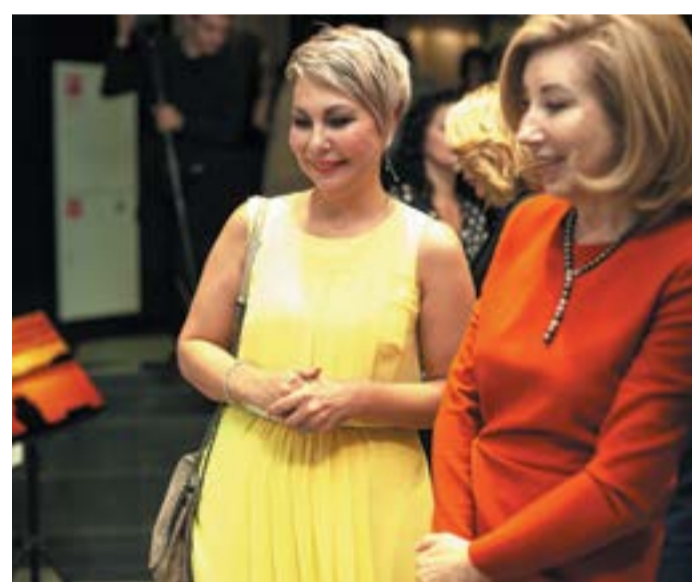
Директор фонда рассказывает о детском творчестве

активно участвует в мероприятиях фонда, приезжая поддержать маленьких пациентов: рассказывает о своей истории, вдохновляет детей и вселяет надежду и веру в лучшее.