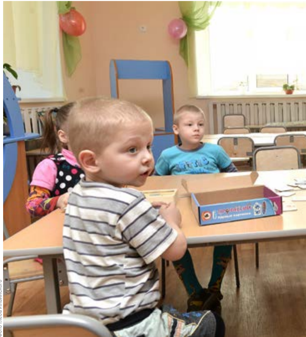
На сегодняшний день почти 90 тысяч юных приморцев посещают детские сады

Воспитательница из Владивостока учит детей запоминать сказки с помощью интеллект-карт