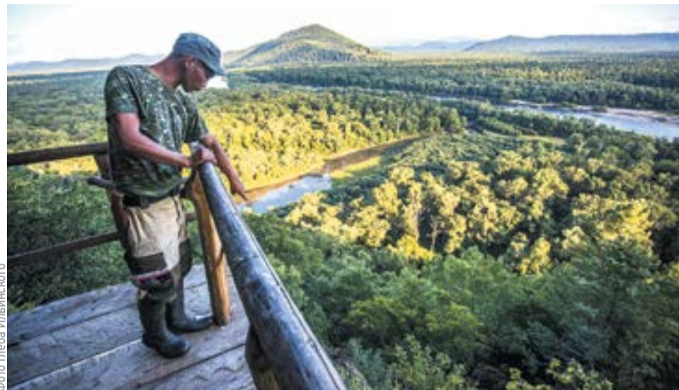
В 2018 году объект всемирного наследия — Центральный Сихоте-Алинь — был расширен и в его состав включили долину реки Бикин

Статус Всемирного наследия исторических объектов повышает узнаваемость региона