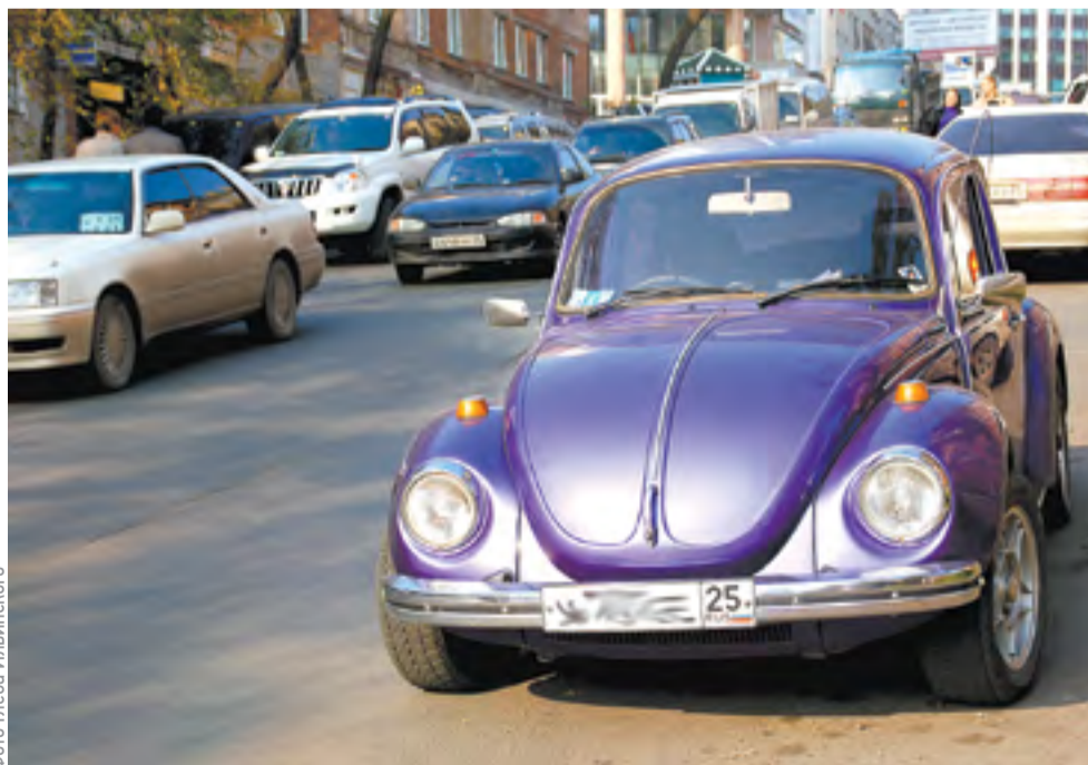
Узнать все о своей машине владелец сможет через портал