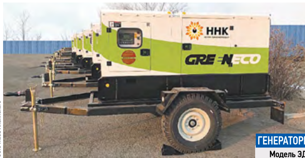
Дизель-генераторы позволят быстро восстановить нормальную работу «заправки» после любого циклона

Приморские АЗС оснащают специальными генераторами для работы в условиях непогоды