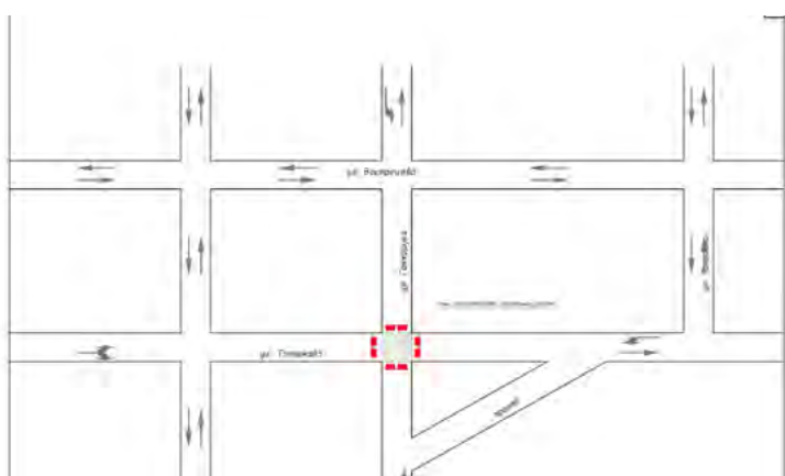
Схема организации дорожного движения в месте производства работ на пересечении ул. Топоркова и ул. Гончарука в г. Уссурийске

Приложение № 1 к постановлению администрации Уссурийского городского округа от 09.03.2023 № 558