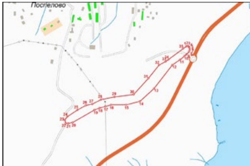
Приложение № 2 к приказу инспекции по охране объектов культурного наследия Приморского края от 07 апреля 2017 г. № 105