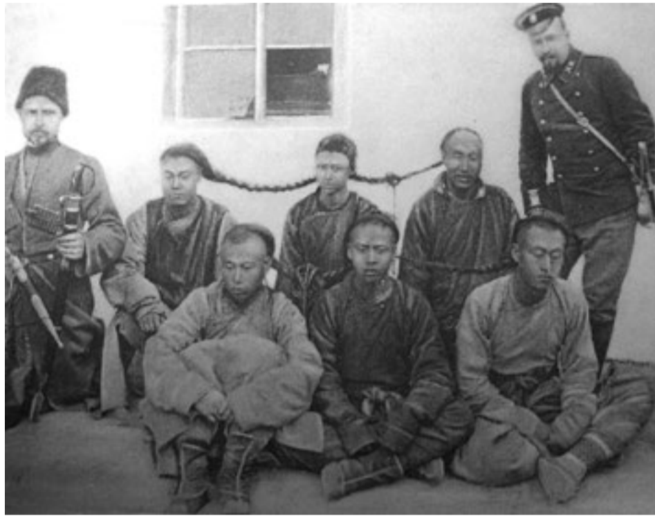
Группа пленных хунхузов

В следующем номере сообщались такие интересные подробности. «Десант» отправился из Владивостока в 7 часов вечера на «шампуньке» — небольшой китайской шлюпке. В ней поместились 15 рядовых 1-го Восточно-Сибирского линейного батальона под командованием подпоручика Лисицина, переводчик, полицейский чиновник и один матрос Сибирского флотского экипажа, знающий местность внутри Русского острова. Плюс один офицер-волонтер, который и описал всю экспедицию под псевдонимом Т. Выразался он довольно официально: