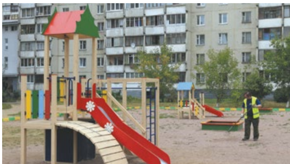
Одна из самых популярных заявок — на создание детской площадки около дома

На что потратить средства, в каждом муниципалитете определяют самостоятельно. Главными инициаторами при этом выступают жители городов и поселков. Люди предоставляют планы благоустройства в местные администрации, а последние должны сформировать единый проект и к 1 апреля подать информацию в краевой департамент по жилищно-коммунальному хозяйству. После этого будет общественное обсуждение инициатив, и лучшие из них претворят в жизнь. Работы начнутся с 15 мая — дня, когда муниципальные программы окончательно утвердят. Соответственно, уже до конца года проекты, вошедшие в шорт-лист, должны быть полностью завершены.