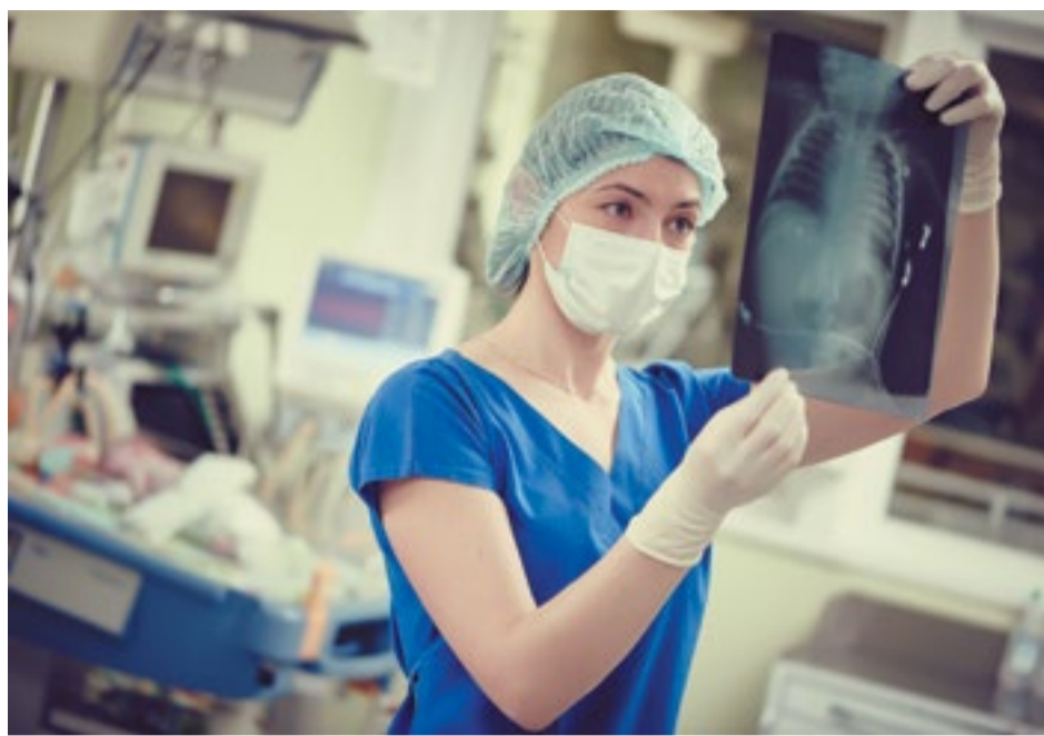
Единственный способ узнать о туберкулезе на ранней стадии — вовремя сделать флюорографическое обследование

— На раннем этапе туберкулез поражает легкие в маленьком объеме, очаг не превышает одного-двух сантиметров. На этой