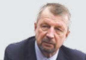
СЕРГЕЙ ГИМАЕВ, заслуженный тренер России, ведущий хоккейный эксперт страны:

— «Адмирал» часто недооценивают. Очень здорово изменился клуб, в первую очередь в плане менталитета. Если раньше дальневосточная команда во многом формировалась по остаточному принципу, то сейчас все по-другому. «Адмирал» смог подобрать игроков, не переплачивая за «дальневосточный коэффициент». Поэтому сегодня команда из Владивостока — это хороший сплав молодых и опытных игроков, россиян и иностранцев. Четкая линия видна в работе тренеров.