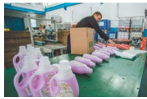
Производство запустили месяц назад, и бытовая химия от резидента СПВ уже появилась в магазинах Приморья

бросается и адрес поставщика — приморский, а не корейский. Продукцию из Приморья компания планирует поставлять на всю территорию России, после Москвы начнут искать дистрибьюторов в Московской области и других регионах. В своих силах руководство «Восток-Поликор» уверено потому, что их бытовая химия сможет «побить» конкурентов не только качеством, но и ценой. Благодаря преференциям режима свободного порта Владивосток компании удалось снизить стоимость продукта для российского покупателя, утверждает резидент.