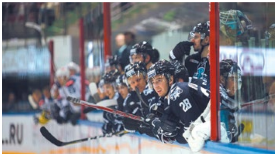
Игроки «Адмирала» с трудом преодолели регулярный чемпионат, зато в плей-офф выступили лучше, чем когда бы то ни было

На некоторое время болельщики и игроки даже поверили в то, что «Адмирал»