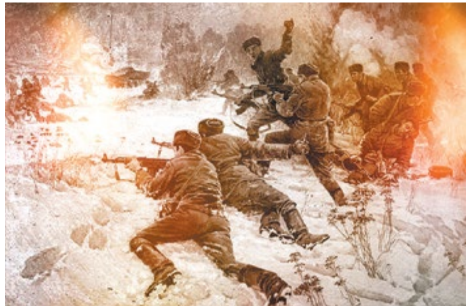
Картина художника Н. Н. Семенова

Наши пограничники старались такие случаи пресекать, причем у них была строгая установка применять огнестрельное оружие лишь в крайнем случае. В первое время действовали уговоры, потом пришлось пускаться в ход кулаки. Однако в марте 1969 года пограничникам пришлось сразиться не с неор-