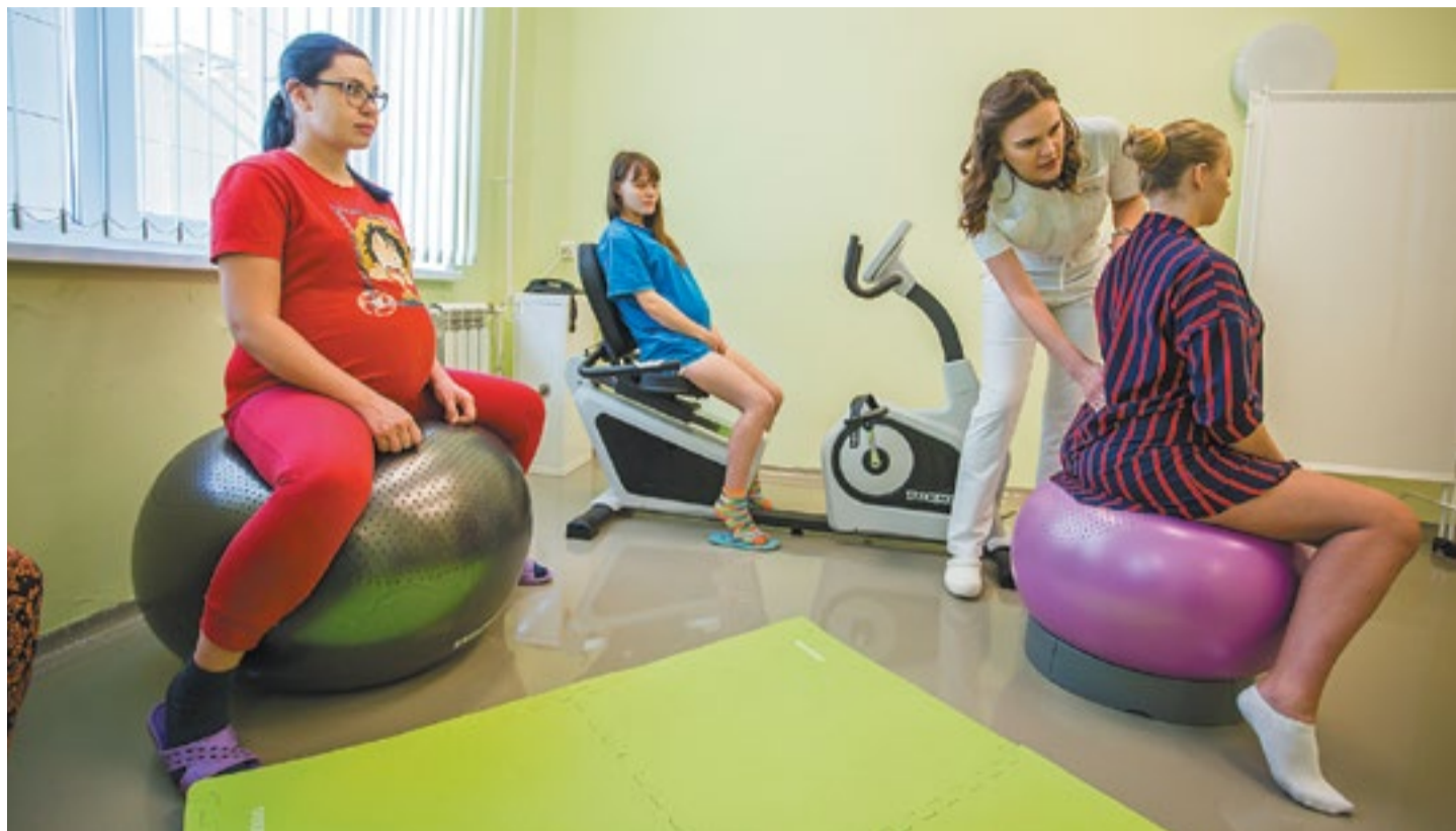
Будущие мамы занимаются гимнастикой, чтобы легче перенести роды

Коврики предназначены для отработки стойки в коленно-локтевой позе — именно так многим женщинам легче переносить схватки. Живот «повисает» и перестает давить на множество кровеносных сосудов, сосредоточенных в тазовой области, и боль уменьшается. Большие мячи нужны для отработки сидячих поз во время схваток. В таких позах уменьшается давление на спину, позвоночник, тазовые мышцы опять же расслабляются. Точно такие же