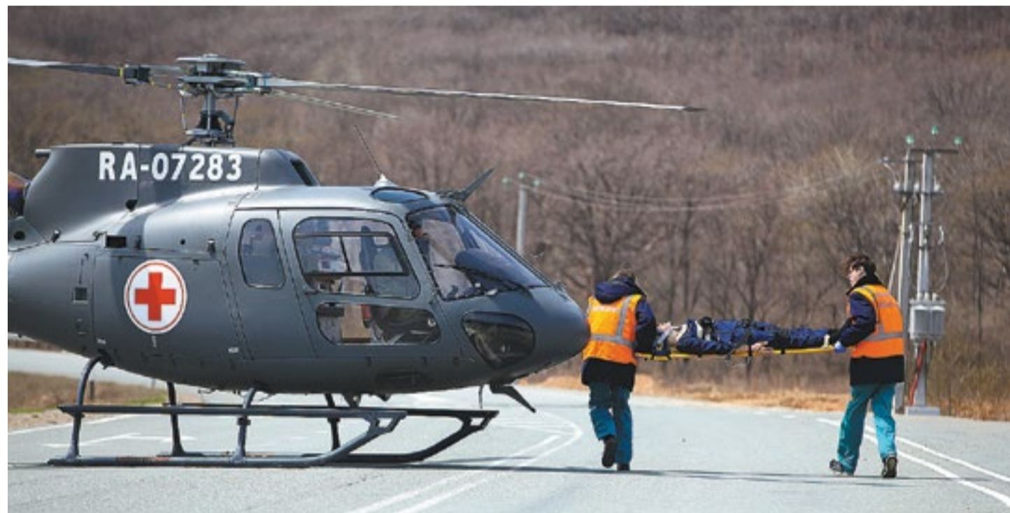
За год работы санитарной авиации в больницы доставили более 200 тяжелобольных пациентов

В рамках Свободного порта Владивосток будут созданы пять жилых комплексов и две гостиницы, предприятия по выращиванию,