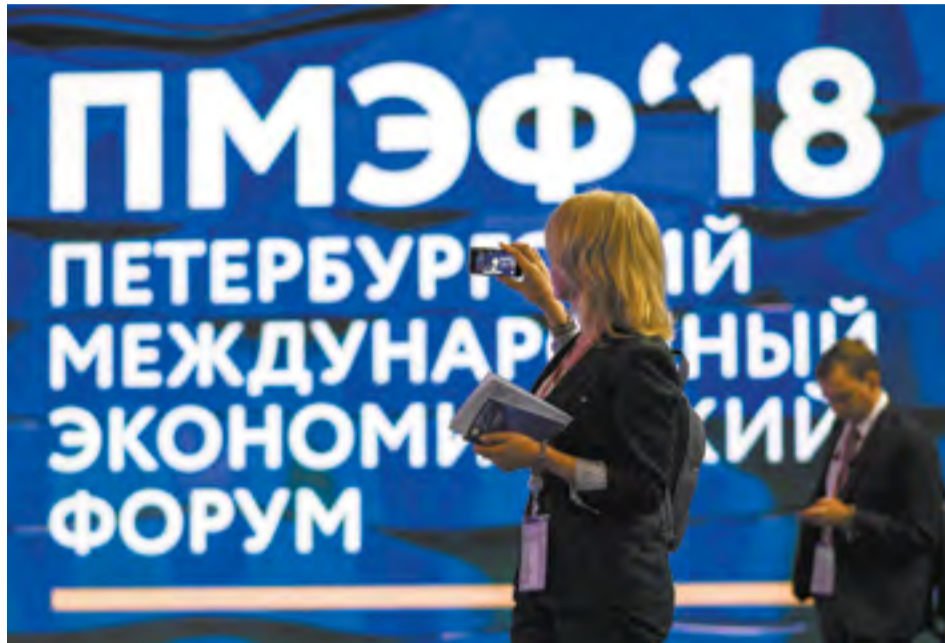
Вопросы развития макрорегиона будут изучать на отдельной пленарной сессии

— Дальний Восток занимает 37% территории России. Это один из крупнейших макрорегионов, который сейчас стал фактически флагманом для всей страны. Здесь были реализованы прорывные проекты,