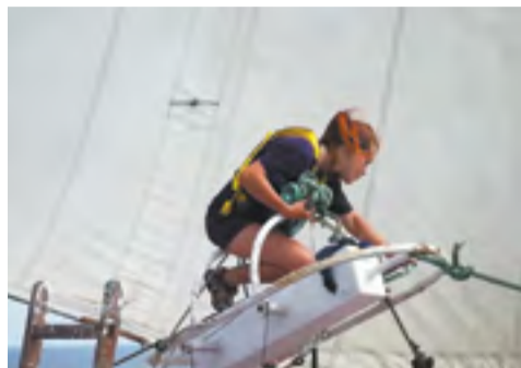
Море всегда прекрасно: в жизни, в кино, на фото

Очевидно, что одним из ведущих направлений предстоящего телефестиваля станет морская история и современный день морского Приморья. На «Человеке и