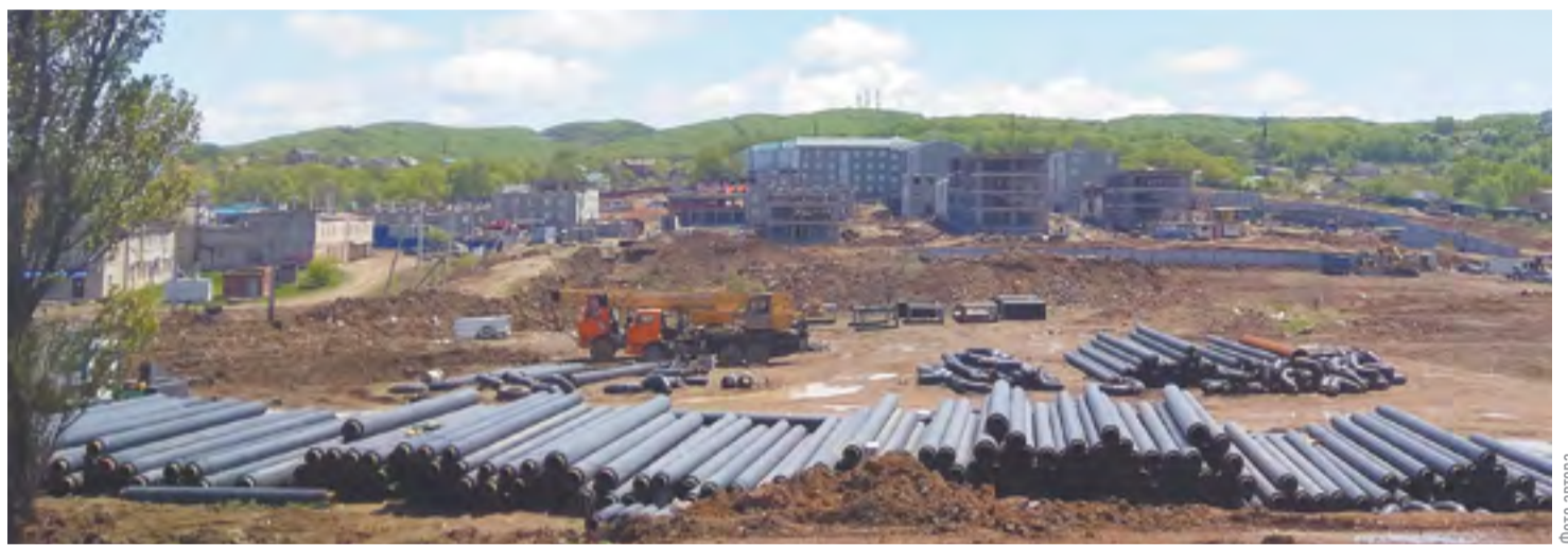
Большой Камень — большая стройка

Для нового микрорайона «Садовый» газомазутную модульную котельную