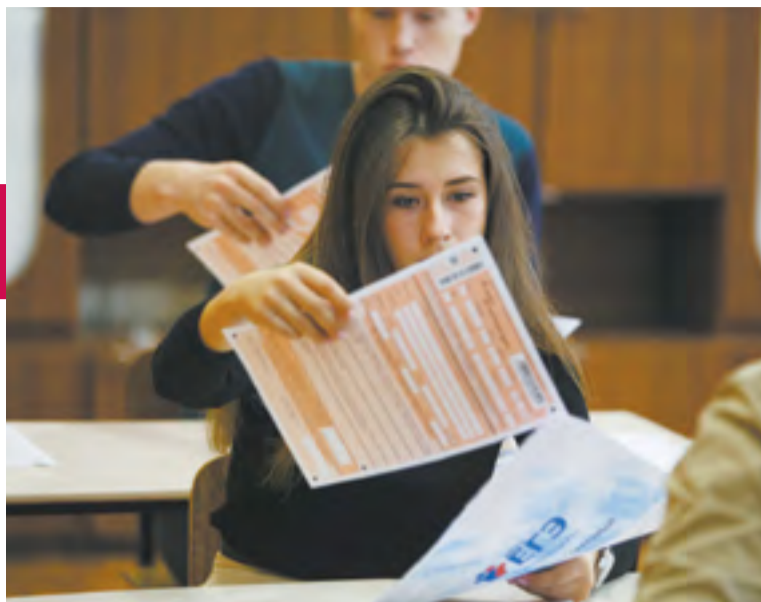
Самыми популярными предметами, по данным на 1 марта 2018 года, у выпускников стали обществознание и физика

Обязательное сочинение по литературе, которое пишут все ученики выпускных классов, также может принести дополнительные баллы к ЕГЭ. Распечатать текст не нужно — достаточно опо-