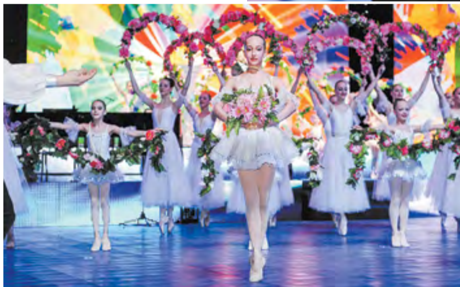
Дельфийские игры добирались до нашего края почти 20 лет