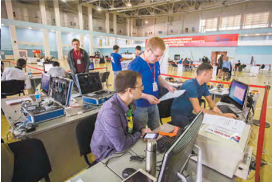
В Приморье найти работу и «прокачать» профессиональные навыки помогает международное движение WorldSkills

У каждой компетенции есть свои модули и критерии оценки, максимум можно набрать сто баллов. Если человек их набирает, то его можно считать лучшим профессионалом в этой области во всем мире. Однако если мы говорим о национальных чемпионатах, то на них можно максимально набрать не 100 баллов, а 80. То есть планка ниже, чем у мировых чемпионатов. А на региональных чемпионатах обычно высшая отметка держится на уровне 50–60 баллов. Однако они могут варьироваться. Например, если мы строим в Приморье суда и хотим, чтобы они были лучшими в мире, то нам и специалисты нужны соответствующие. А значит, и требования к ним должны быть намного выше, чем к обычным судостроителям.