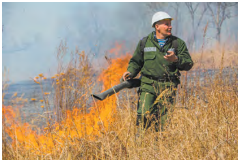
Лесопожарные воздуходувки сбивают пламя со скоростью 90 м/сек

— С наступлением весны космическими спутниками на территории Приморского края ежедневно регистрируется порядка 190 аномальных термоточек, — уточнил врио заместителя начальника главного управления МЧС по Приморскому краю по государственной противопожарной службе Игорь