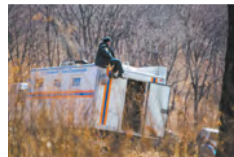
Специалист знает, где безопасно во время пожара