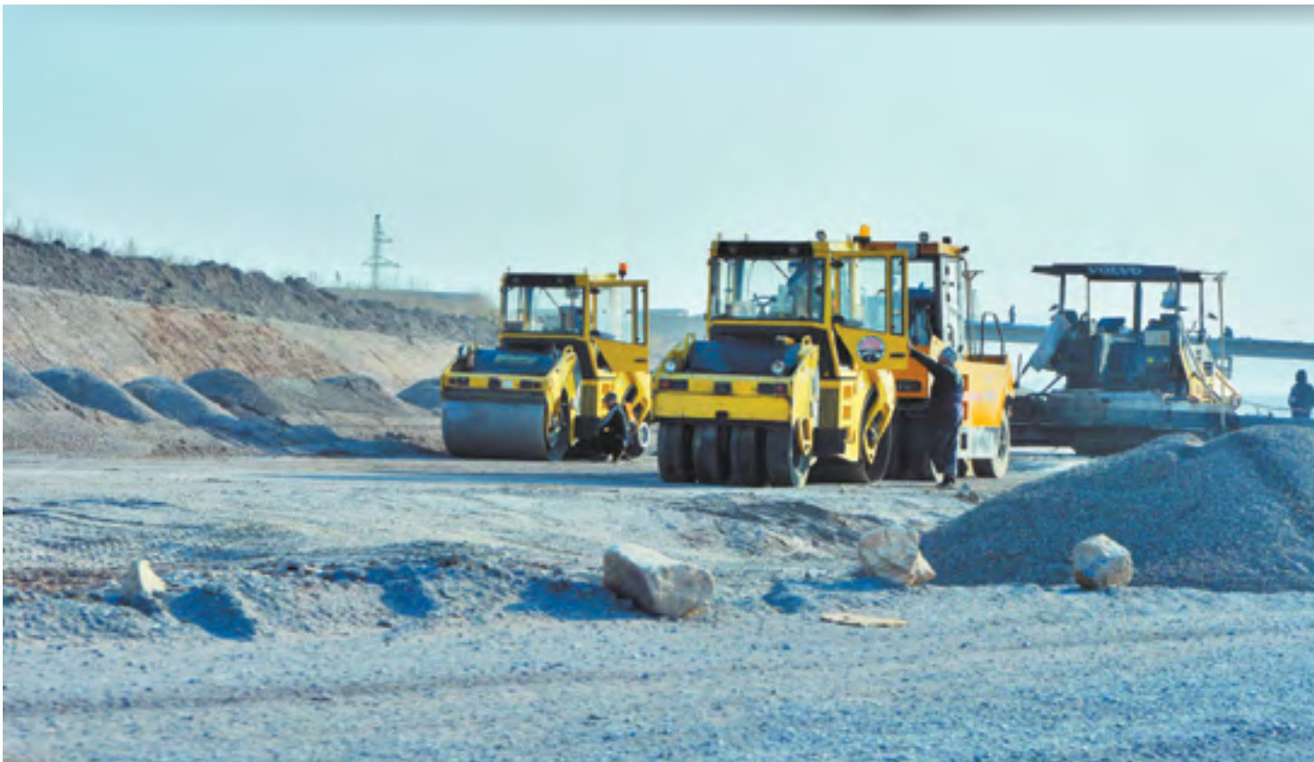
Строители будут ремонтировать дороги по новым правилам

ОФИЦИАЛЬНОЕ ИЗДАНИЕ ОРГАНОВ ГОСУДАРСТВЕННОЙ ВЛАСТИ ПРИМОРСКОГО КРАЯ | WWW.PRIMGAZETA.RU