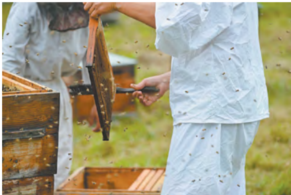
В Приморье работают около 7 тысяч пасечников, а приморский мед собирают более 72,4 тысячи пчелиных семей

Отраслевики уверены, что, не смотря на то что мед из Китая захватил рынок Азиатско-Тихоокеанского региона (АТР), у приморского продукта есть безусловные преимущества: его сбор ведется на экологически чистых пространствах, вдали от промышленных мощностей, поэтому в регионе производят нату-