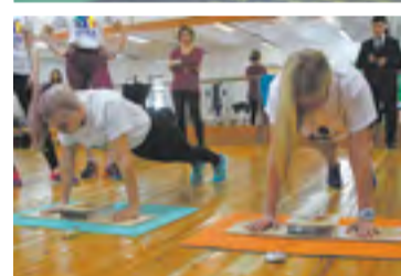
На фестивале ГТО все как в большом спорте: старты, победы, удачи и проигрыши

ЗА ДВА ГОДА ТЕСТИРОВАНИЕ В КРАЕ ПРОШЛИ 10 800 ЧЕЛОВЕК, ИЗ НИХ НОРМАТИВЫ КОМПЛЕКСА ГТО НА ЗНАКИ ОТЛИЧИЯ ВЫПОЛНИЛИ 5330. НА ЗОЛОТОЙ ЗНАЧОК СДАЛИ 1800 ЧЕЛОВЕК, СЕРЕБРЯНЫЙ — 2400, БРОНЗОВЫЙ — 1090 ЧЕЛОВЕК