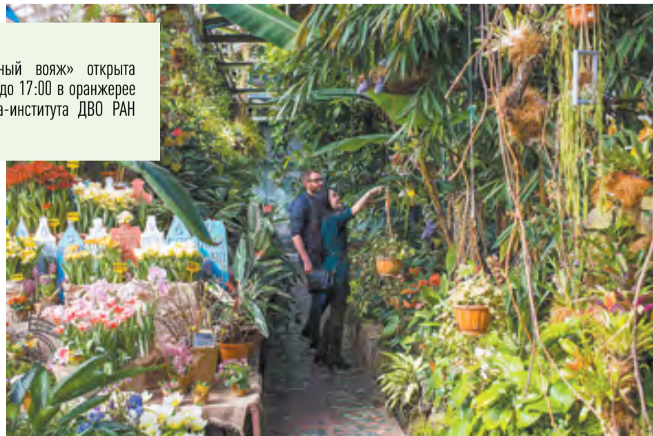
Накануне женского дня Ботанический сад-институт ДВО РАН превратился в царство редких и экзотических растений

Выставка «Цветочный вояж» открыта ежедневно с 10:00 до 17:00 в оранжерее Ботанического сада-института ДВО РАН до 11 марта.