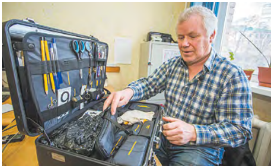
В чемоданчике криминалиста — самые обыкновенные инструменты, с помощью которых творятся чудеса расследования

— У людей отпечатки берут с помощью типографской краски — это называется «откатыванием». Эксперт-криминалист сравнивает их со следом, который он