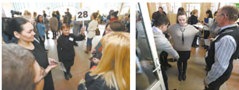
На «взрослых» экзаменах было все по-настоящему: сборы в экзаменационные группы, проверки металлоискателем и, конечно же, вопросы тестов

будет сдавать экзамен и в какой аудитории. Схему рассадки определили накануне при помощи специальной компьютерной программы. Родители подходят, читают, сдают на хранение личные вещи: сумки, ключи, телефоны. С собой на экзамен нельзя пронести ничего, кроме паспорта. Каждого проверяют при помощи металлоискателя. Если у участника находят телефон или ключи, отправляют обратно. Несмотря на то что сегодня ЕГЭ сдают понарошку, организаторы строго выдерживают формат настоящего экзамена.