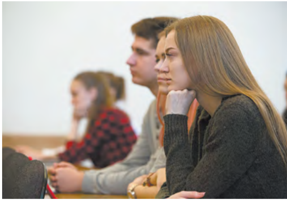
Молодое поколение готово участвовать в честных выборах

— Мы сейчас готовим своих членов комиссий: специально обученные люди