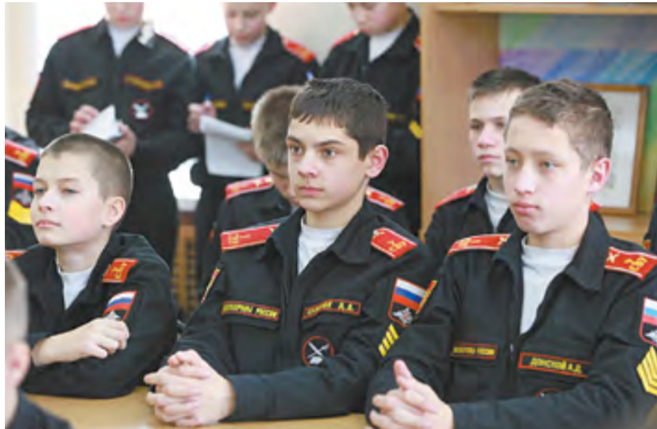
Более 50 выпускников Уссурийского суворовского военного училища стали генералами

Во-вторых, мы говорим о мальчишках, а ведь все они любят соревноваться. У нас составляются рейтинги успеваемости между ротами и взводами. По итогам учебного года лучшая рота получает переходящий приз — бюст Суворова. Сейчас он находится у первой роты: стоит на входе в роту, у тумбочки дневального. Мальчишки изо всех сил стараются, чтобы в следующем году именно их роту признали лучшей.