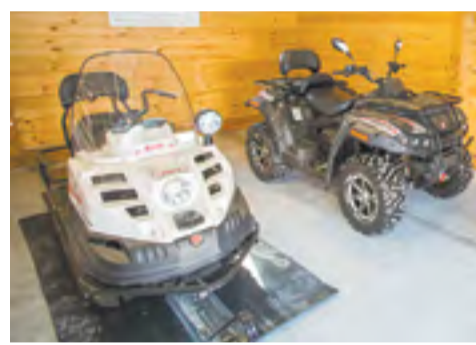
Сотрудники на кордонах будут меняться вахтовым методом

— Кордонную инфраструктуру активно использовали в советское время, но потом о такой практике, к сожалению, забыли, — заметил помощник Владимира Путина. — Мы решили вернуть ее. Работа сотрудников охотнадзора опасна, связана с лишениями. Они постоянно — в лесу, встают на пути у людей, которые уже решились на преступление и, как правило, хорошо вооружены. Только за прошлый год шесть инспекторов пострадали от браконьеров в Приморье, два автомобиля сожжены. Наша задача — сделать максимально комфортными для них условия отдыха.