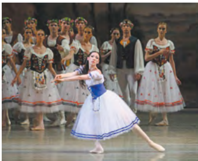
«Жизель» — один из первых и самых знаменитых французских балетов