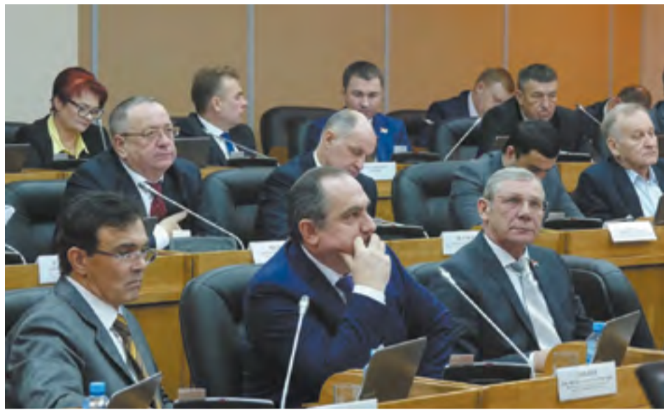
Одно из главных направлений работы депутатов — это принятие бюджета края и его корректировок в течение года

— Действительно, это не оспоришь. И поэтому возникают дискуссии, иногда споры. Но в конфликтную плоскость это не переходит. Люди все взрослые, следят за своими словами и действиями. Да, есть принципиальные позиции, которые у разных партий расходятся. Например, фракции КПРФ и ЛДПР не голосуют за принятие краевого бюджета уже много лет, но в процессе его обсуждения с исполнительной