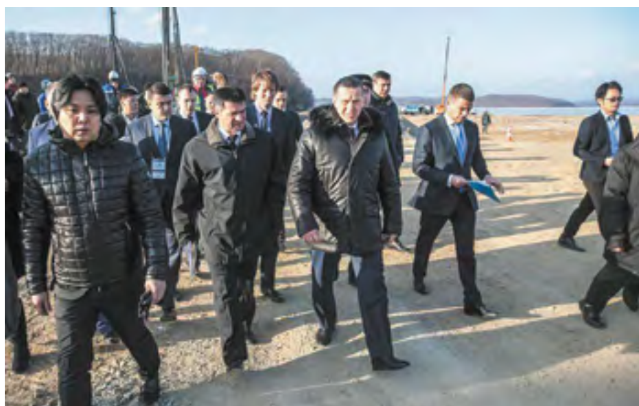
Полпред напомнил: «Перед регионом стоит задача войти в течение трех лет в первую половину национального рейтинга состояния инвестиционного климата»

— За последние три года вышло 22 федеральных закона, 70 актов правительства,