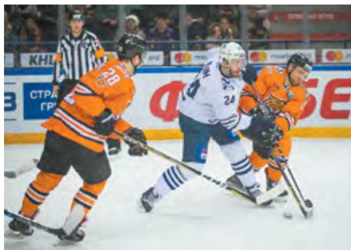
У двух дальневосточных команд Континентальной хоккейной лиги — «Адмирала» и «Амура» — особенные взаимоотношения

В минувшие выходные приморский «Адмирал» в очередной раз встретился со своим самым принципиальным соперником — «Амуром» из Хабаровска. Первое дальневосточное дерби в нынешнем соревновательном году осталось за «тиграми». Пропустив первыми, хабаровчане впоследствии сумели отыграться и в заключительном периоде вырвали победу. Итоговый счет матча — 1:2 в пользу «Амура». «Адмирал» же очков не набрал и остался на 12-м месте в турнирной таблице Восточной конференции.