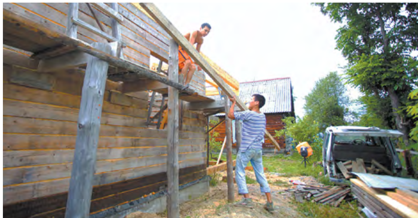
Семья строит новый дом в поселке Красный Яр. Бесплатная древесина в нашем регионе положена только коренным народам Севера и Дальнего Востока

Допустим, заявителю услуги выдан участок, где преобладают самые дорогие хвойные леса. Надо иметь в виду, что ближай-