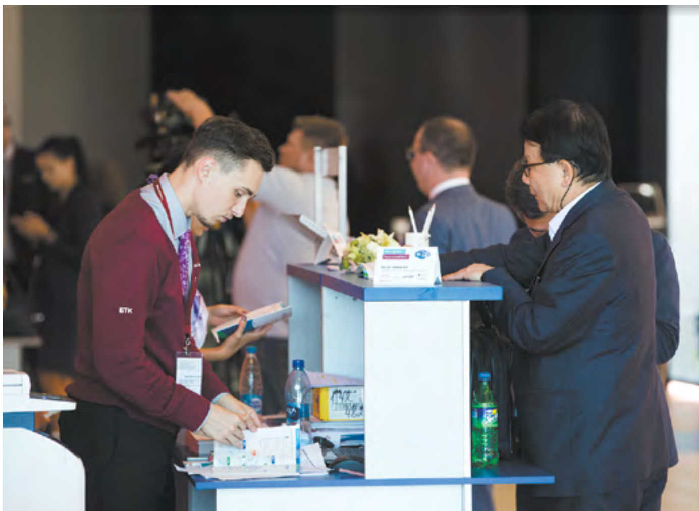
На территории Приморского края более 200 добровольческих объединений помогают в организации и проведении социальных, экологических, патриотических акций

ОФИЦИАЛЬНОЕ ИЗДАНИЕ ОРГАНОВ ГОСУДАРСТВЕННОЙ ВЛАСТИ ПРИМОРСКОГО КРАЯ | WWW.PRIMGAZETA.RU