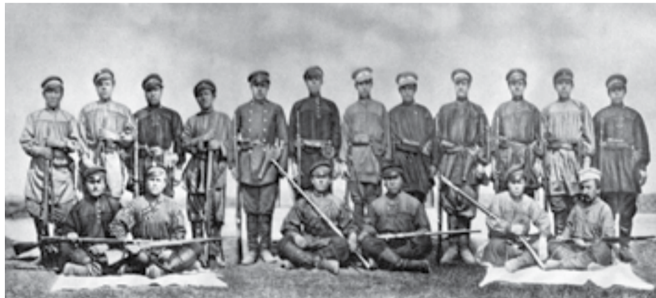
Конвой 4-й экспедиции под руководством Николая Пржевальского

Затем офицер побывал в Никольском, в Посвете, в корейском городе Кыген-Пу, в Шкотово и на Сучане, в бухтах Ольги и Владимира, описав фактически весь юг современного Приморья. В начале зимы 1867 года Николай Пржевальский по реке Тадуши (теперь Зеркальная) поднялся к Сихотэ-Алиню, перевалил через хребет и по Лифудзину (Павловке) вышел к Уссури. До телеграфной станции Бельцовой на реке Даубихе (Арсеньевка) отряд добрался уже в новом 1868 году. Позже он подвел итог: «19 дней шли мы сюда из гавани Ольги