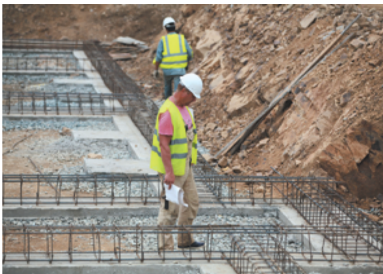
Каждый строительный объект имеет свою историю

Чтобы защитить интересы участников долевого строительства, объект был взят на особый контроль. Инспекция организовала взаимодействие строителей, ресурсоснабжающих организаций, органов местного самоуправления