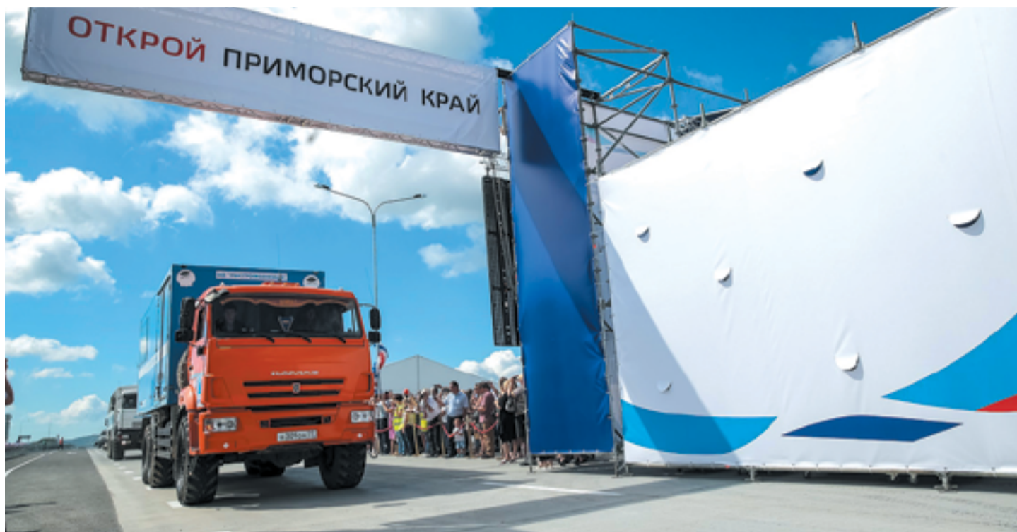
«Приморье-1» и «Приморье-2» являются важной точкой стыковки «Одного пояса, одного пути» и Евразийского экономического союза

Благодаря заметным географическим преимуществам Приморья устанавливаются прочные связи с приграничными провинциями Китая на самых разных уровнях. Влади-