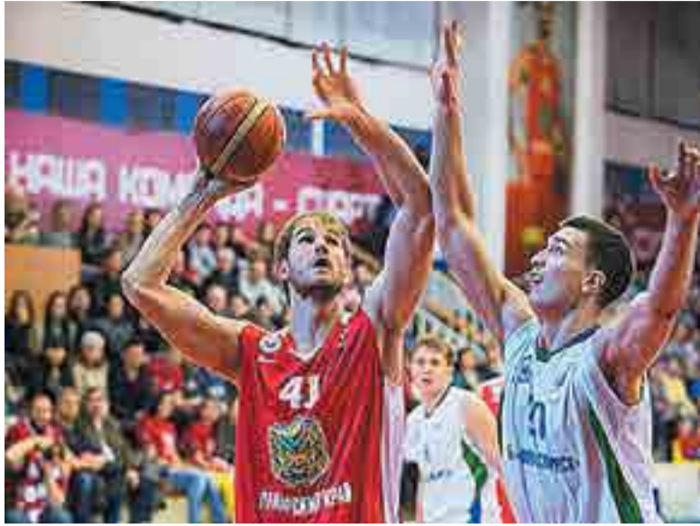
СЕРИЯ ФИНАЛЬНЫХ МАТЧЕЙ СЕЗОНА ПРОДОЛЖИТСЯ ВО ВЛАДИВОСТОКЕ.

За всю первую четверть сибирякам не удалось провести ни одного трехочкового броска, к концу игрового отрезка «Спартак-Приморье»