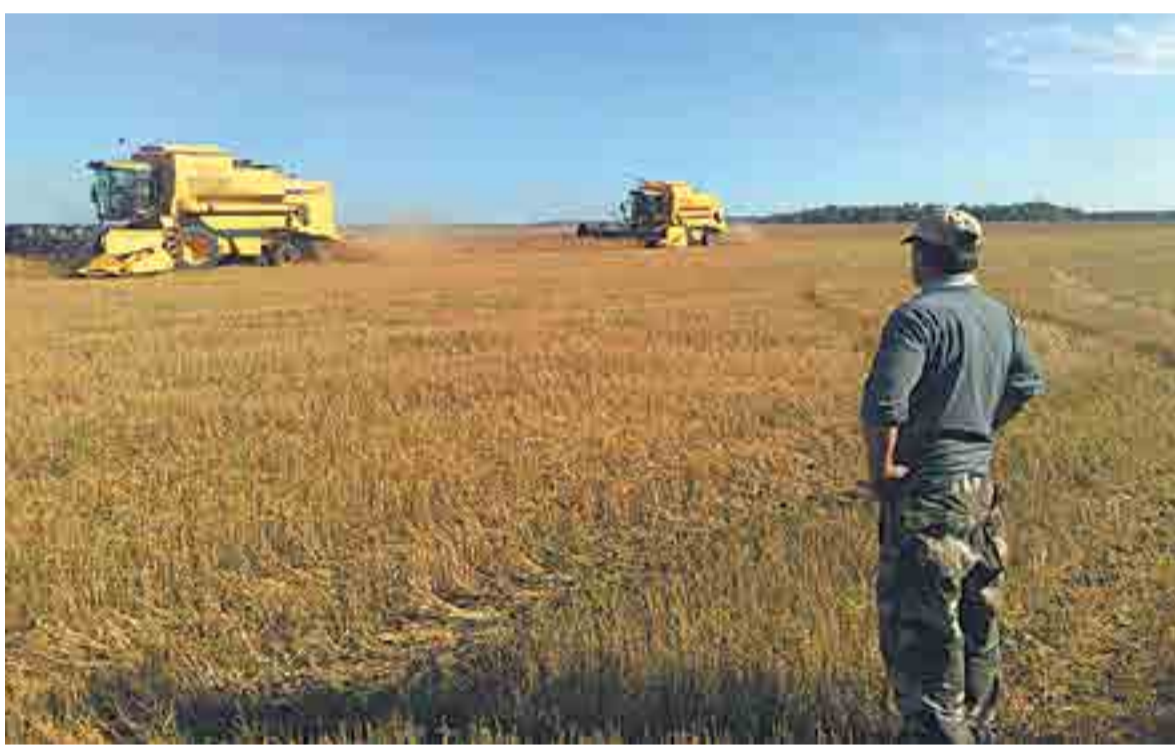
ШТРАФЫ ПОЗВОЛЯТ ВЕРНУТЬ ЗЕМЛЮ ТЕМ, КТО БУДЕТ ЕЕ ОБРАБАТЫВАТЬ.

По мнению специалистов, подобная ситуация сложилась из-за того, что в законе не предусмотрена эффективная мера наказания для нарушителей. До 2014 года штра-