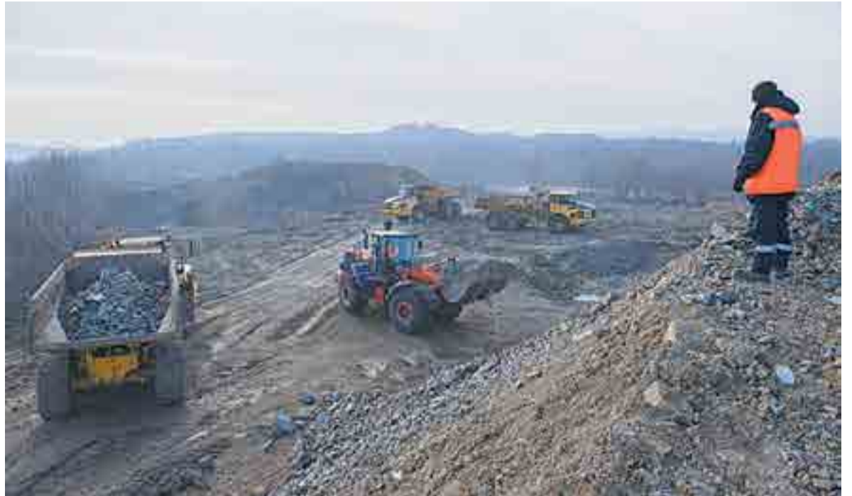
Льготы бизнесу помогут вдохнуть жизнь в депрессивные населенные пункты.

Инвестирующим в моногорода предприятиям предоставят льготы