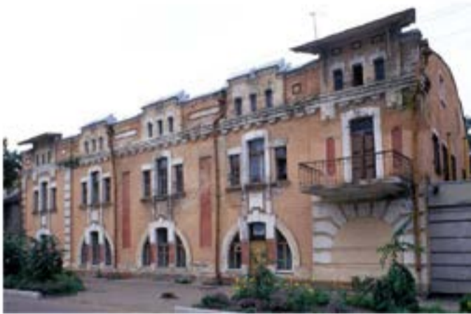
Главный (юго-восточный) фасад

Архитектурно-стилистическое решение здания, его декоративное оформление выполнены в стиле модерна. Архитектурная детализровка выполнена выпусками кирпича, рустовка (всерная, линейная).