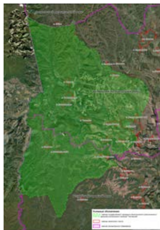
СХЕМА ТЕРРИТОРИИ ЗАКАЗНИКА

к Положению о государственном природном биологическом (зоологическом) заказнике регионального значения «Полтавский»